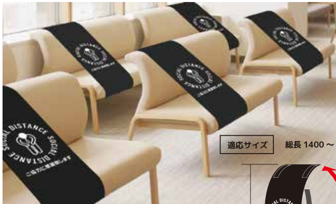
▲カバーA(ナイロン製) 多様な形状のイスに設置が可能