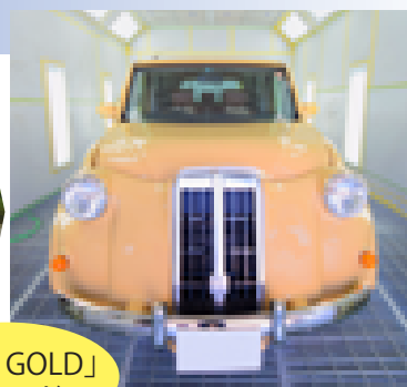
「STAY GOLD」 ブランド